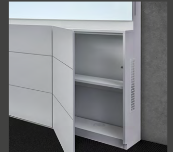
Stauraum für die Technikintegration