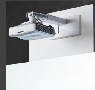
Horizontal verstellbare Montageadapterplatte für Projektoren